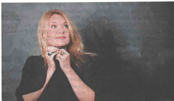
Magdalena Kožená livre «Le chant de la Terre».