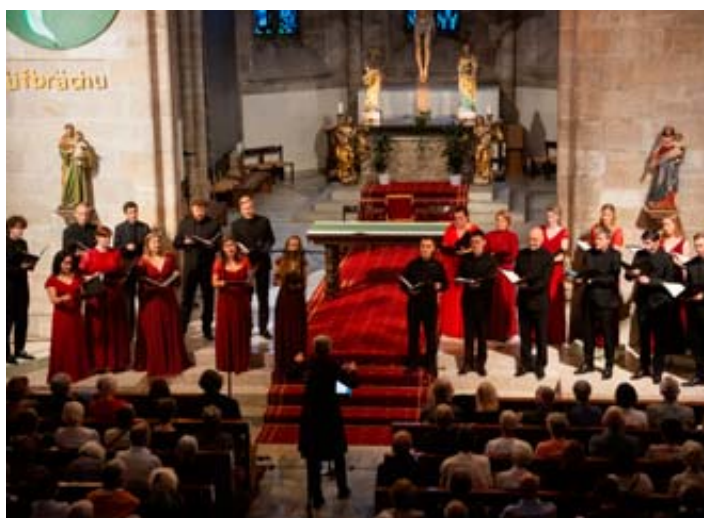
The Norwegian Soloists' Choir, une belle découverte. CÉLINE RIBORDY