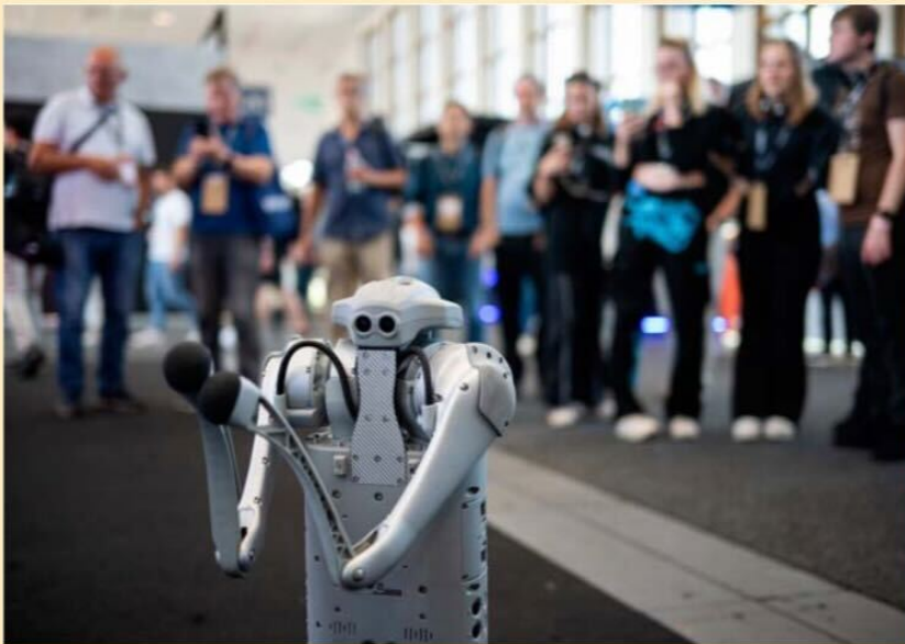
Le robot Go1 se tient devant les visiteurs du stand Unitree Robotics «Männchen» lors du Salon international de l'électronique grand public (IFA) à la Messe Berlin, qui se termine aujourd'hui. Depuis 1924, les exposants présentent leurs innovations au Funkausstellung de Berlin.