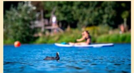
Sur le Werdersee, en Basse-Saxe, où des températures d'environ 25 degrés ont déjà été mesurées hier, une foule de nage devant un pagayeur.