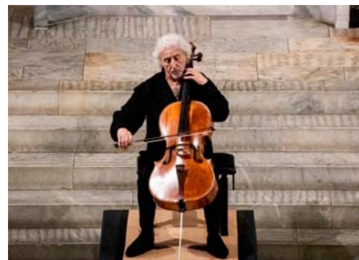
La légendaire Misha Maisky a fait sa première apparition à Sion.