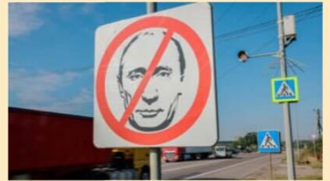
Un faux panneau routier, représentant un portrait barré du président russe Vladimir Poutine, a été installé le long d'une autoroute dans la région de Rivne, en Ukraine.