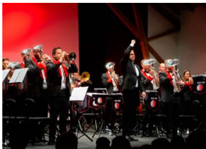
Le Brass Band 13 Etoiles avec le trompettiste Sergei Nakariakov.